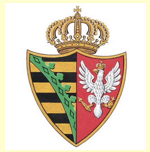
HERB KSIĘSTWA WARSZAWSKIEGO