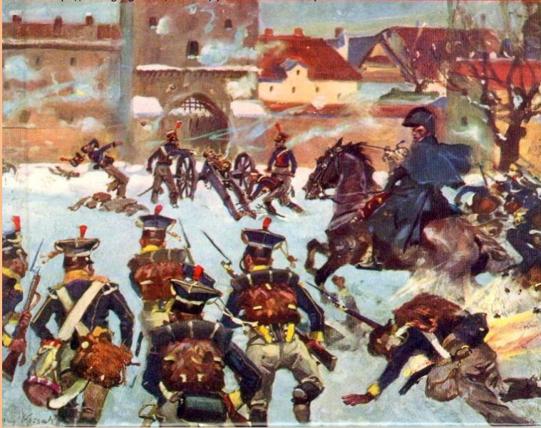
Szturm na bramę Gdańską (23 II 1807) Ob. J. Kossak