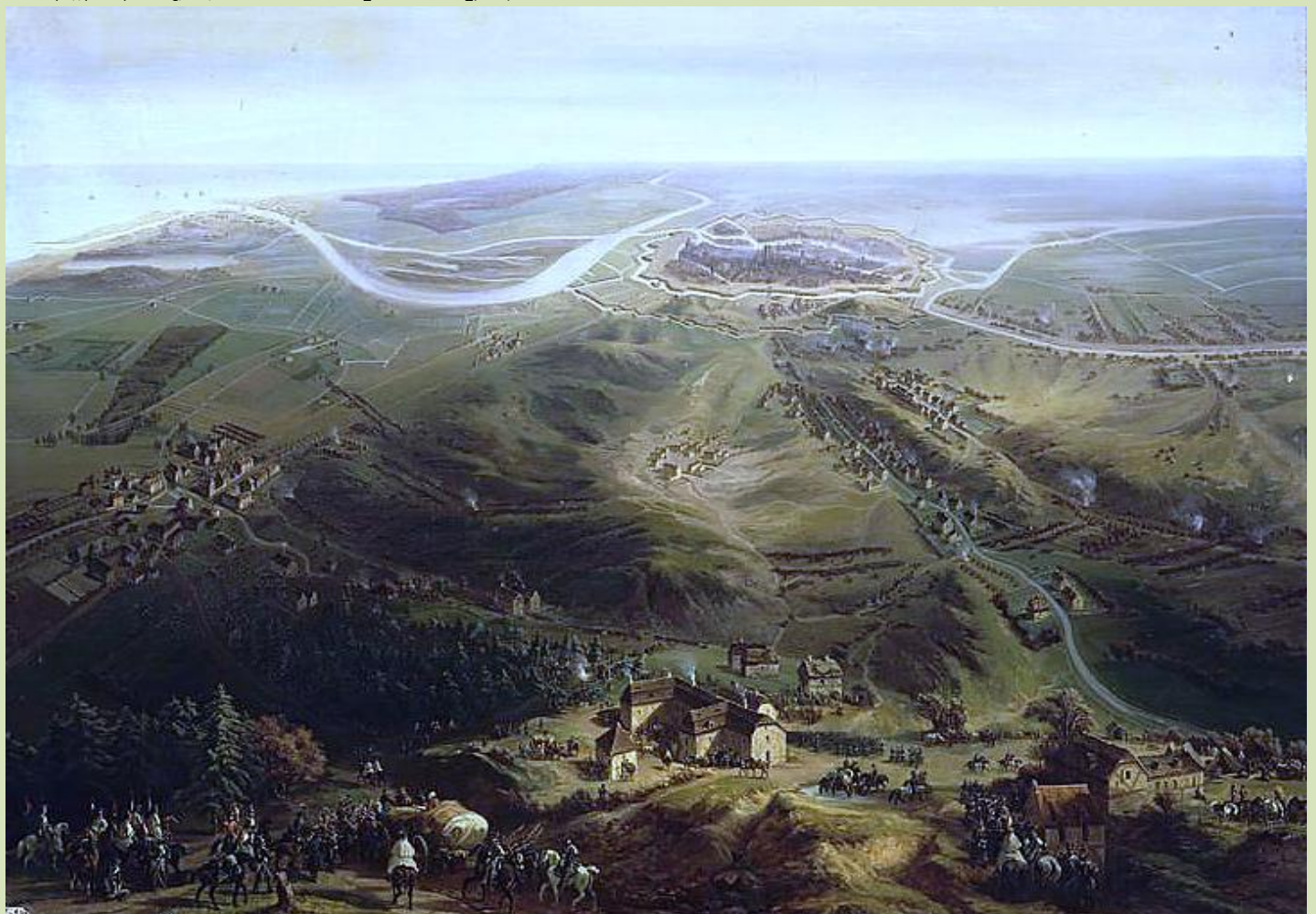
Panorama oblężonego Gdańska (7 marca – 27 maja 1807) Jean-Antoine-Siméon